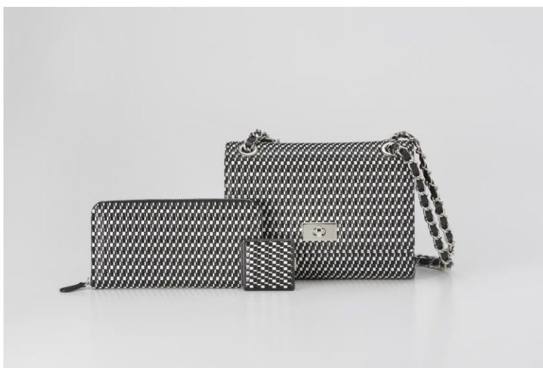
INDEN EST. 1582 新作「RIPPLE」

鹿革に漆で模様付けする伝統的工芸品、甲州印伝を製造販売する株式会社 印傳屋 上原勇七は、印傳屋グローバルシリーズINDEN EST. 1582「RIPPLE（リップル）」を3月1日（水）より国内販売をいたします。